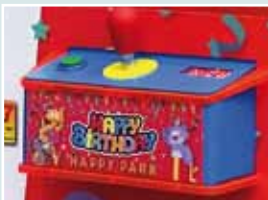
Panel de mandos