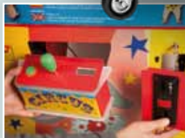
Fácil acceso a componentes