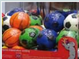
Detalle de los premios