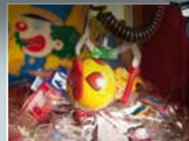
Detalle de la grúa