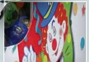
Detalle de la decoración