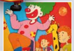
Detalle de la decoración