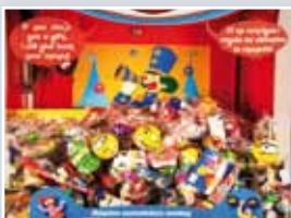
Detalle de los premios