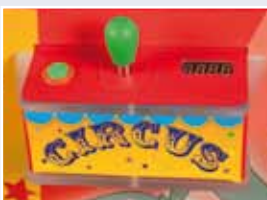
Panel de mandos