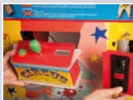
Fácil acceso a componentes