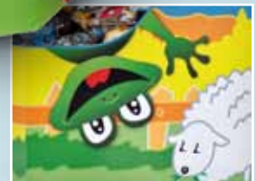
Detalle de la decoración