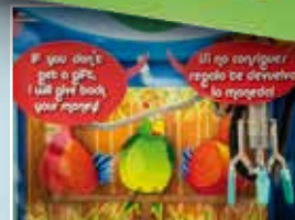
Detalle de la grúa