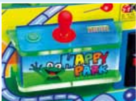
Panel de mandos