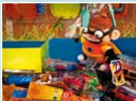
Detalle de los premios