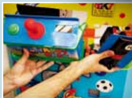
Fácil acceso a componentes