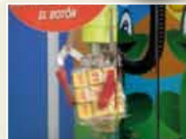
Detalle de la grúa