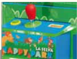
Panel de mandos