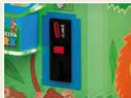
Fácil acceso a componentes