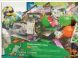
Detalle de los premios