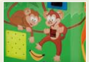
Detalle de la decoración